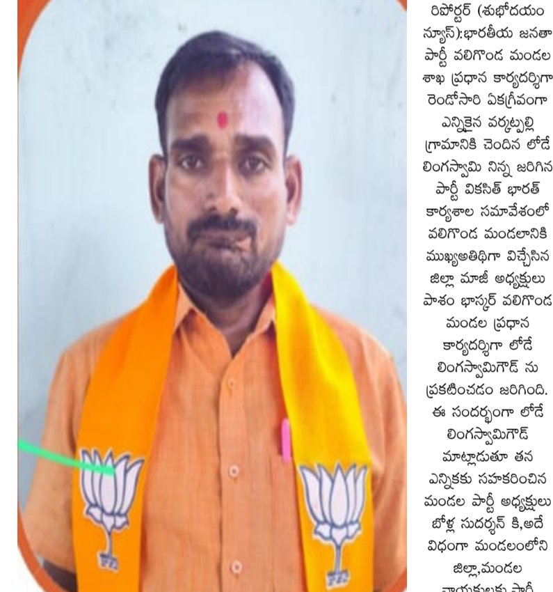
సీనియర్ నాయకులకు,బూత్ అధ్యక్షులకు,కార్యకర్త బంధువులందరికీ పేరుపేరునా ధన్యవాదాలు తెలియజేశారు.